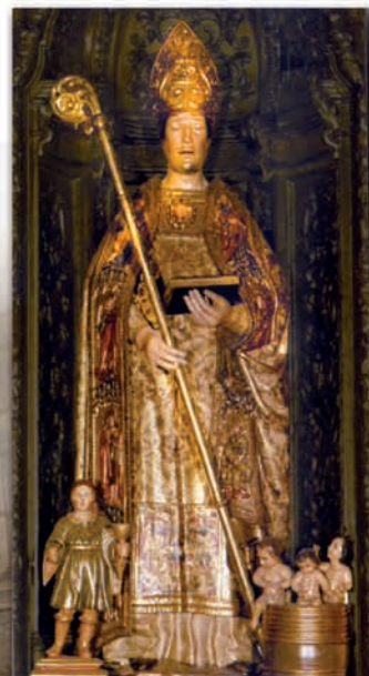
IMAGEN DE SAN NICOLÁS VENERADA EN ALICANTE DESDE EL S. XV.